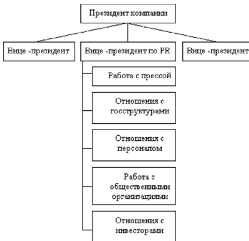
Схема 1. Структура отдела по связям с общественностью

Существует три основных типа структур отдела по связям с общественностью.