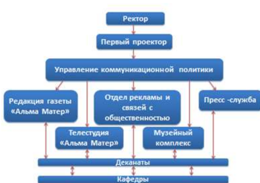
Схема 4. Действующая структура позиционирования Тамбовского государственного технического университета

Настоящим новшеством в сфере позиционирования высших учебных заведений явилось создание студенческого PR - агентства, которое стало структурным подразделением отдела рекламы и связей с общественностью Тамбовского государственного технического университета.