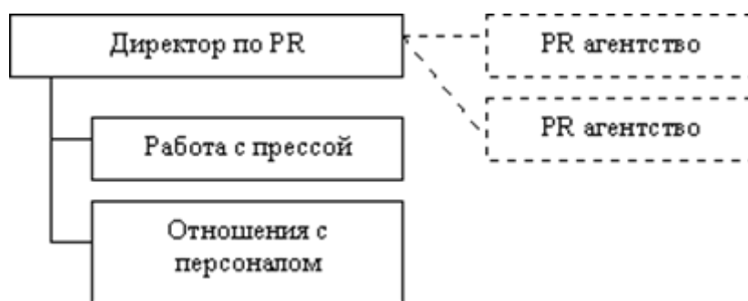
Схема 3. Минимизированная структура PR отдела

Функциями отдела являются работа с прессой и отношения с персоналом – то есть та работа, на которую нанимать стороннего консультанта нелогично, так как необходимо глубокое знание компании и сотрудников. Такая схема подходит, когда организации, прежде всего, необходимы внутренние коммуникации. Чаще всего причиной создания такой структуры является необходимость решения острых кризисных ситуаций, а также осознание определенных неудобств, связанных с привлечением PR - специалистов или PR - агентств со стороны (различные затраты как средств, так и времени; незнание чужой